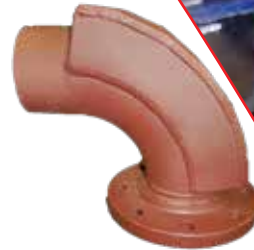
Coude CastoTube® renforcé avec des revêtements de polymères MeCaTec®