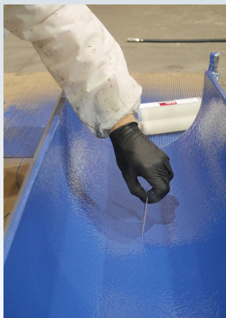
MeCaWear® 300 und 400 bieten elastomer-modifizierte Technologie, die eine höhere Beständigkeit gegen Rissbildung durch Stoß- und Dauerbiegebeanspruchung gewährleistet.

Max. Einsatztemperatur – Trockenbetrieb 90°C